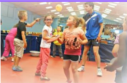
Mai 2016 Echo N°6 - Animations scolaires