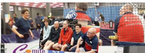
Janvier 2020 Echo N°13