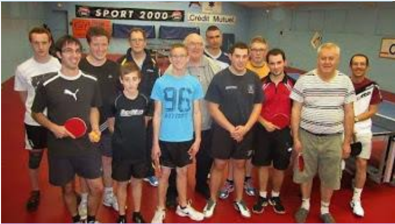
Juin 2014 Echo N°2 - Entraînement du mercredi soir

S'ENTRAÎNER POUR PROGESSER ET PARTAGER DES MOMENTS FORTS ENTRE COPAINS